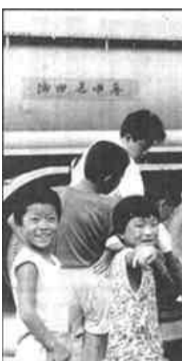
河口区农村社会养老保险事业发展快

9月5日，在首都人民大会堂香港厅，一条对中国家电行业具有冲击力的信息通过中央电视台、《人民日报》、《经济日报》、《科技日报》、中央人民广播电台等40多家新闻媒体迅速传播开来：伴随着海尔集团产品结构国际化思路汇报暨海尔彩电产品介绍会的召开，拉开了海尔集团跨行业资产重组序幕，首次进入黑色家电领域，迈开了海尔发展史上历史性的一步。